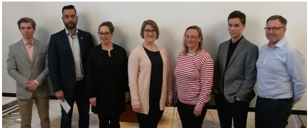
Porin seuraparlamentin jäsenet.

LiikU on tehnyt viime vuosina valtakunnallisestikin merkittävää yhteistyötä kuntien kanssa maksuttomien koulutusten järjestämiseksi seuroille. Kuntien liikunta-toimet ovat huomanneet, että seuratoimijoiden osaamisen lisäämisellä on liikuntaolosuhteiden parantamisen jälkeen merkittävin vaikutus kuntalaisten liikuttamisessa. Toimintatavaksi on muodostunut, että kootaan lähellä olevia kuntaryppäitä yhteen ja suunnitellaan heidän kanssaan sopivia koulutuksia sen alueen seuroille. Näin saadaan tarpeeksi koulutuksiin osanottajia ja kustannukset pysyvät kohtuullisina. Vuoden lopussa aloitettiin Porin seuraparlamentin perustaminen ja prosessi jatkuu 2018. Kuntien vapaa-ajanviranhaltijoille järjestettiin laivaseminaari ja Kuntien reittipäivät sekä lisäksi oli alueellisia neuvottelupäiviä.