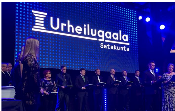
Satakunnan vuoden seuratyöntekijät.