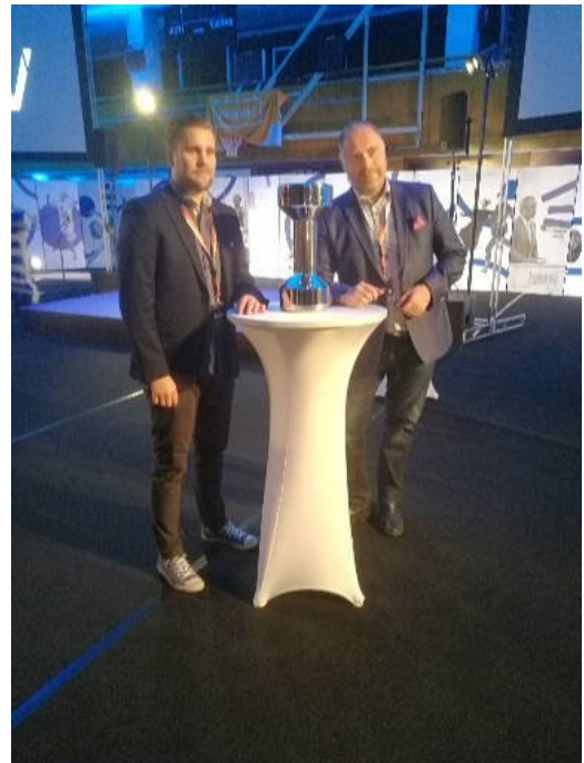
Porin Pesäkarhut olivat ehdokkaana valtakunnallisessa gaalassa Vuoden urheiluseuraksi.