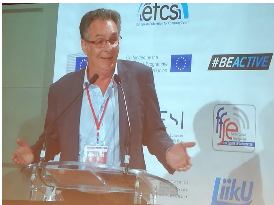
LiikU oli mukana hankkeen I. työpaikkaliikuntakongressissa Pariisissa 27.9.2018. Kuva: European Meeting of Companysport avaustilaisuudesta